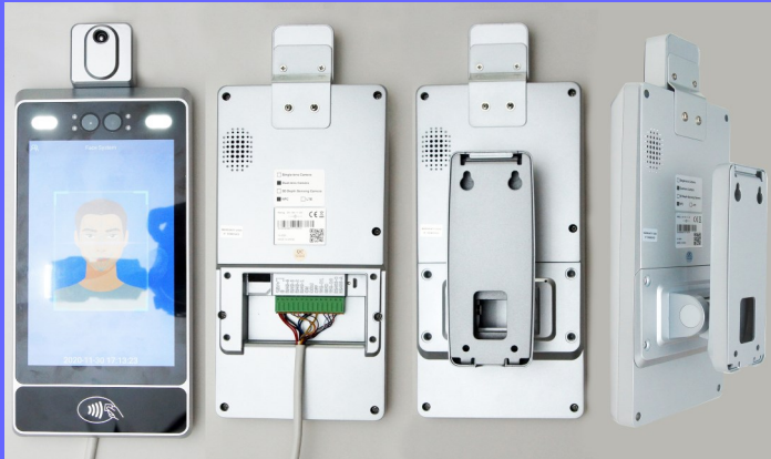
Vorderseite & Rückseite mit Kabelstecker und Wandbefestigung